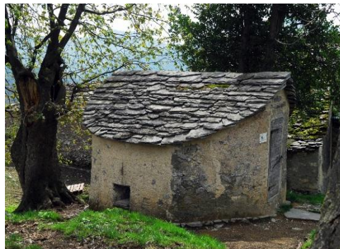
Pianspessa: la nevèra