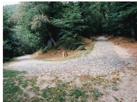
Mulattiera del Caviano