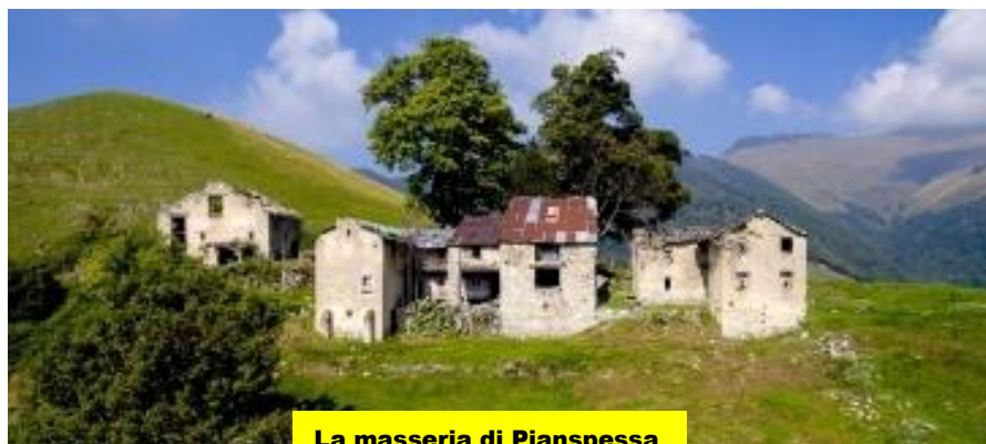
La masseria di Pianspessa

Dopo la visita, sul pianoro davanti al Roccolo, assaporeremo il classico ' HafliPinzAperitivo '.