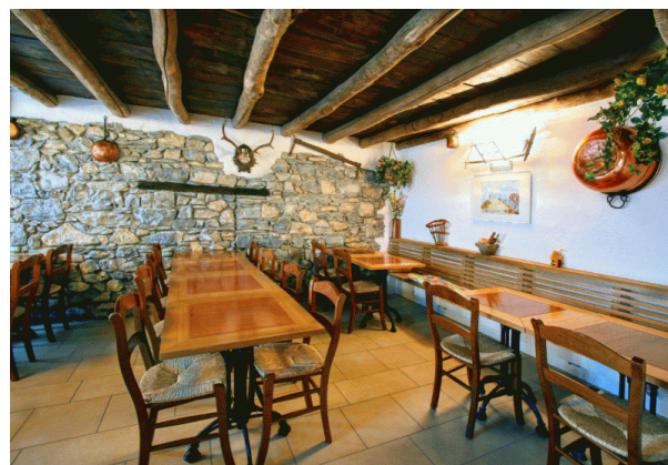
Agriturismo Dosso dell’Ora

⚠ Sarà possibile acquistare ottimi prodotti caseari Dosso dell’Ora.