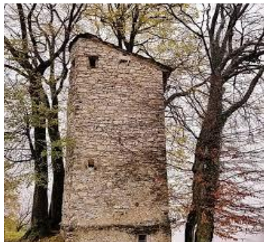
Pianspessa: il roccolo