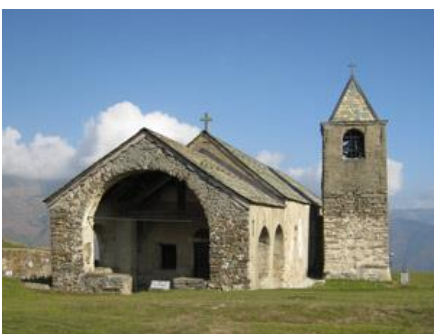
Oratorio di San Lucio