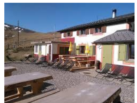
Capanna San Lucio