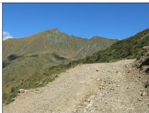
Lo 'sterrato' e, sullo sfondo, la cresta SE del Pizzo di Gino