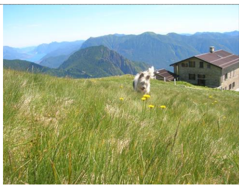
Rifugio Croce di Campo 1