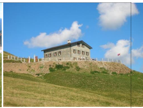
Rifugio Croce di Campo 2